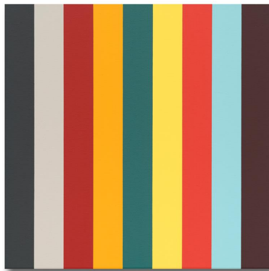
Steven Aalders Nine Colours (Tuscany 4), 2022 Öl auf Leinwand/ Oil on linen 45 x 45 cm