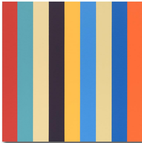
Steven Aalders Nine Colours (Tuscany 2), 2022 Öl auf Leinwand/ Oil on linen 45 x 45 cm