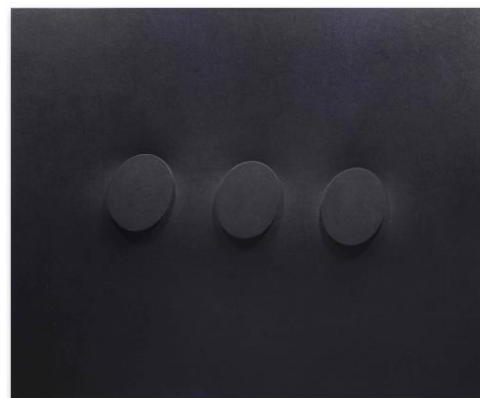
Turi Simeti 3 ovali neri sovrapposti , 2018 Acryl auf geformter Leinwand 100 x 120 cm © Studio Turi Simeti Courtesy Walter Storms Galerie