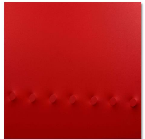
Turi Simeti 7 ovali rossi , 2017 Acryl auf geformter Leinwand 80 x 80 cm

Es folgen längere Aufenthalte in London, Paris und Basel, wo Turi Simeti zahlreiche Vertreter der zeitgenössischen Avantgarde kennenlernt. Inspiriert durch seine Reisen und den Wunsch, seine Kunst von den traditionellen und vorher bereits festgelegten Codes zu befreien, entscheidet sich Simeti Anfang der 60er Jahre für das Monochrom und das Relief als bildgestalterische Elemente. Die Ellipse wird zu seinem Markenzeichen und Code seines künstlerischen Werkes. Die reliefartigen Erhebungen